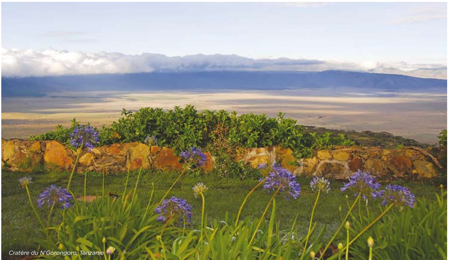
Cratère du N'Gorongoro, Tanzanie

Passez 4 nuits sur les magnifiques plages de Zanzibar, une île de rêve!