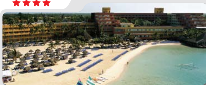
OASIS HAMACA CHAMBRE VUE JARDIN

Départs de Montréal vers la Romana VENDREDI 5, 12 ET 19 FÉVRIER